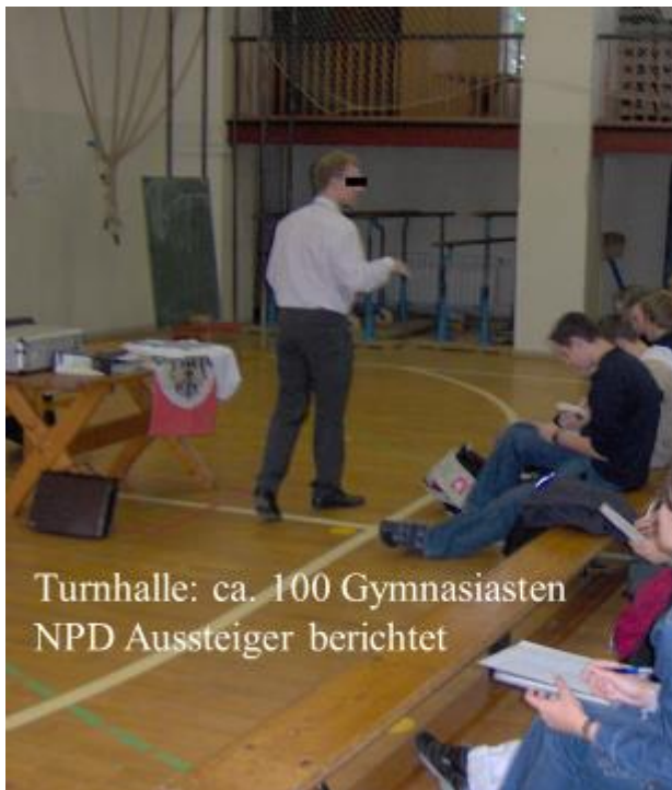
Turnhalle: ca. 100 Gymnasiasten NPD Aussteiger berichtet

Relativ zeitnah gab es auch schon die ersten Wertschätzungen. Diese Auszeichnung erfolgte in der der Frauenkirche Dresden 2005.